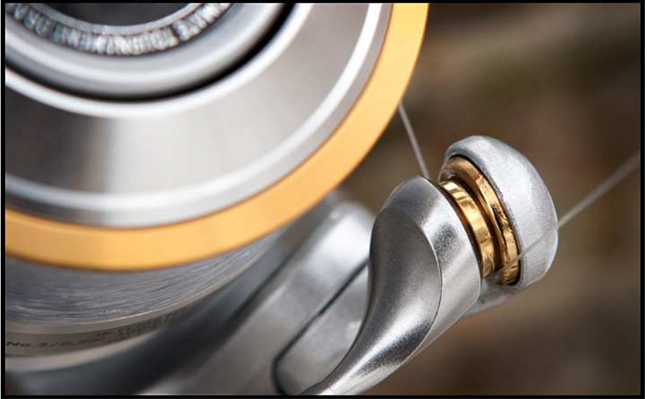
Das Schnurlaufrädchen und die Frontbremse.