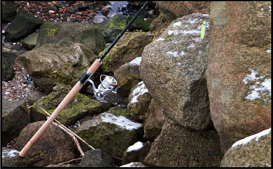
Die Rute mit Rolle und die aufgedruckte Bezeichnung.