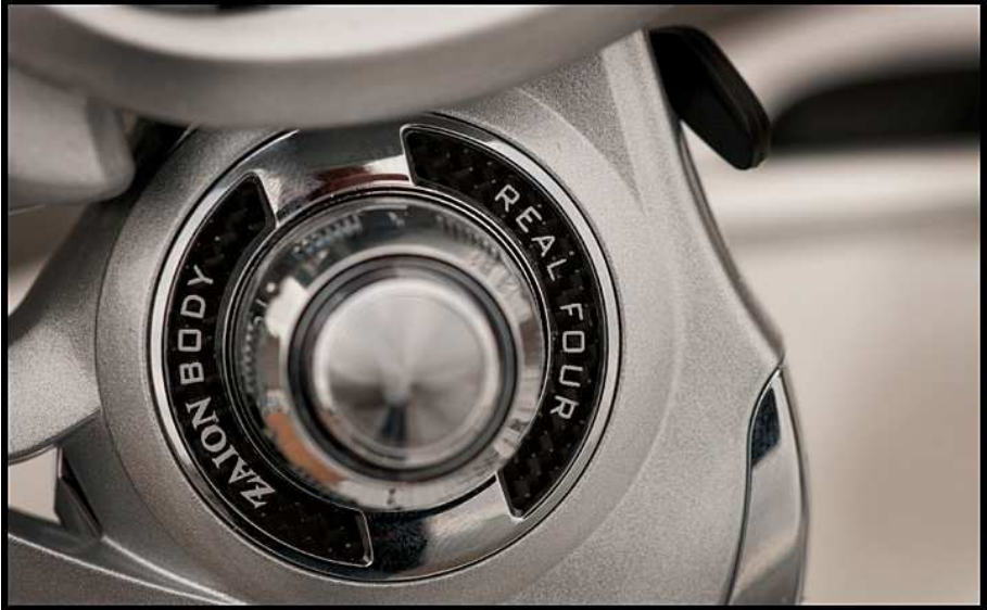
Die Kurbel von beiden Seiten.