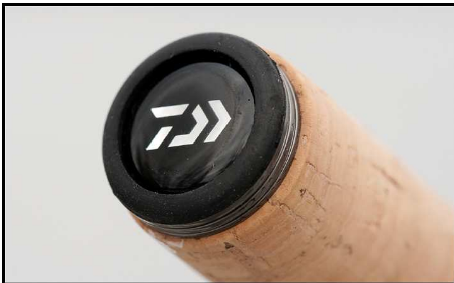
Der Rutenbutt und der Schraubrollenhalter.